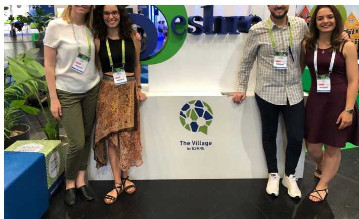
ESHRE Annual Meeting Vienna 2019